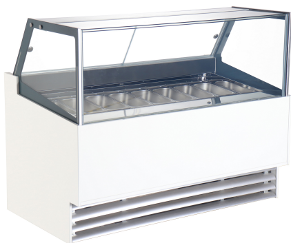
This photo is showing Ice cream display Borneo 12x5L. Model 7487.0255 has a capacity of 9x5L.

Lernen Sie unsere effiziente und stilvolle Speiseisvitrine Phuket kennen!